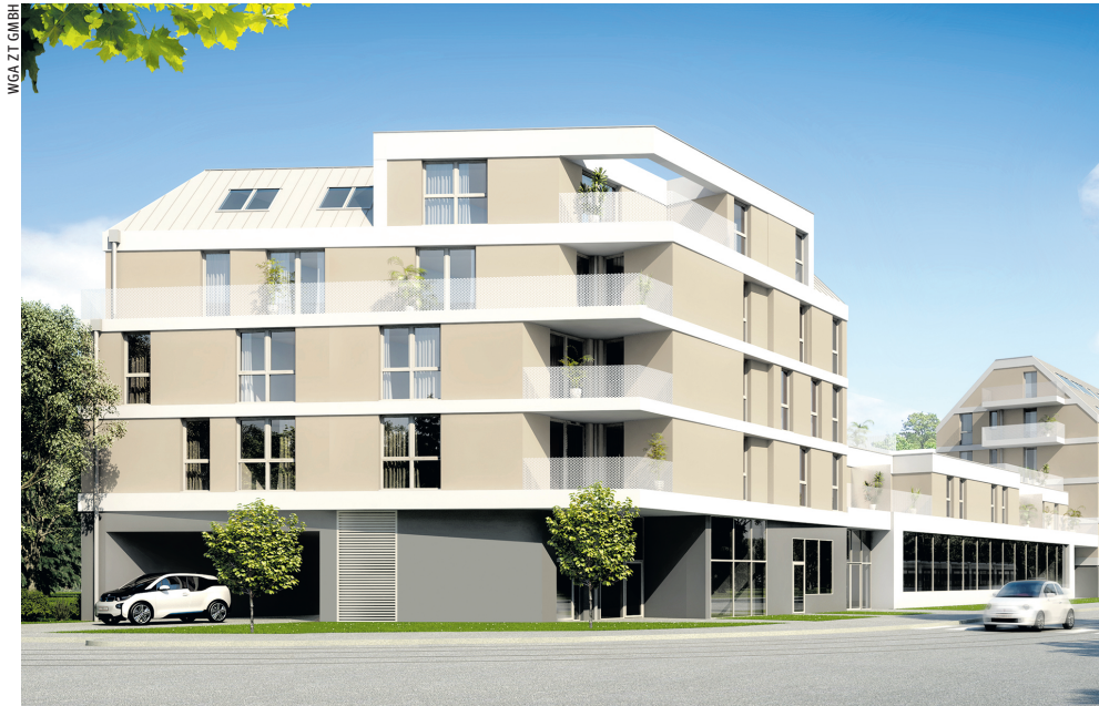
Das neue Haus in der Preyergasse 1-7 in Hietzing garantiert ...

Checken Sie JETZT ein – in einer der „grünen“ Vorsorgewohnungen der RVW in der Preyergasse (Hietzing = 13. Bezirk)!